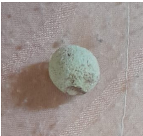
Figura 3 -Cálculo retirado do animal durante a cirurgia.

Conforme relatado por Guimarães et al. (2020), a cistolitectomia em coelhos é indicada em casos onde a eliminação espontânea do cálculo é improvável, seja pelo tamanho ou localização. A ultrassonografia foi suficiente para diagnóstico, embora a radiografia também pudesse ter sido utilizada. O manejo dietético e hídrico inadequado provavelmente contribuiu para o desenvolvimento do quadro. Estudos apontam que a manutenção de dieta rica em fibras, pobre em cálcio biodisponível e com boa oferta de água é essencial para prevenção. O prognóstico é considerado favorável quando a cirurgia é realizada precocemente e o acompanhamento pós-operatório é rigoroso. Apesar da ausência de exames laboratoriais, a resposta clínica positiva e ausência de complicações reforçam a eficácia da abordagem.