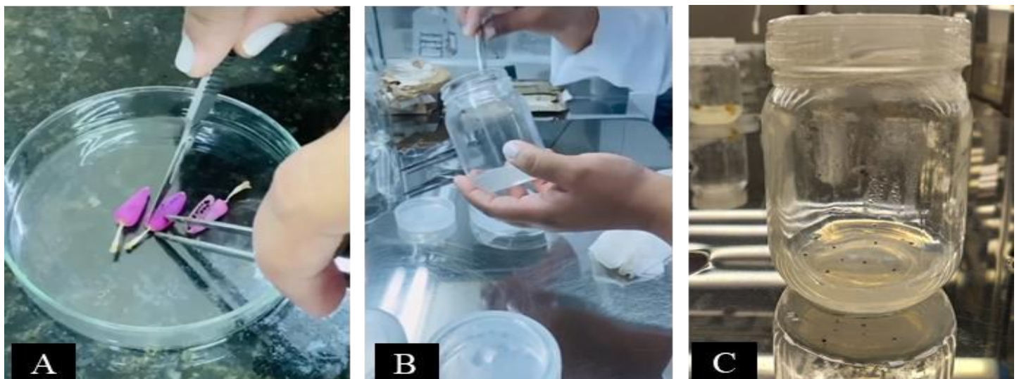
Figura 2. Preparação do material para estabelecimento in vitro . A - Retirada das sementes dos frutos de Melocactus brederooianus . B-C - Inoculação das sementes no meio de cultura.

O experimento foi avaliado periodicamente, monitorando-se a porcentagem e a velocidade de germinação, bem como as fases iniciais do desenvolvimento pós-seminal das plântulas ao longo de 30 dias. Adicionalmente, visando mensurar a eficiência do protocolo de assepsia e a incidência de patógenos latentes, os frascos foram monitorados sistematicamente quanto à manifestação de contaminações endógenas (fúngicas ou bacterianas) pelo período estendido de 180 dias.