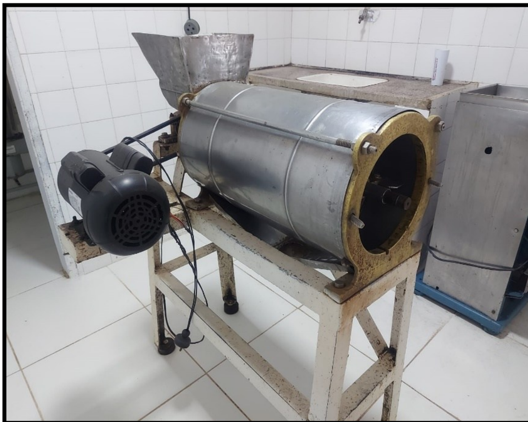
Figura 3. Despulpadeira mecânica horizontal em aço inoxidável utilizada na separação de frações constituintes das frutas.

A etapa de despulpamento constitui o núcleo do processamento tecnológico, sendo a operação unitária responsável pela transformação física da matéria-prima bruta no produto intermediário de interesse comercial. Na unidade semi-industrial investigada, esta operação é conduzida de forma inteiramente mecânica com o auxílio de uma despulpadeira horizontal, equipada com motor elétrico trifásico e chassi estrutural de sustentação ( Figura 3 ).