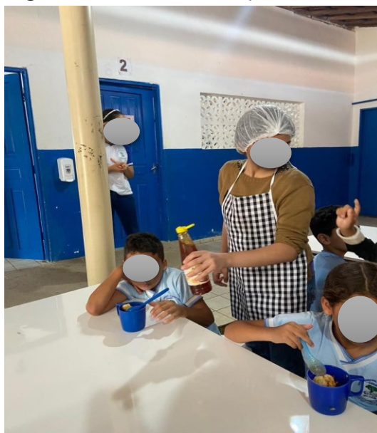
Figura 7 – Oficina de alimentação saudável.

A dinâmica da oficina consistiu na preparação da própria merenda pelos alunos, sendo a primeira receita uma salada de frutas e a segunda, bolinhos de carne. A atividade ocorreu no pátio da escola, onde os alunos cortaram as frutas com o auxílio dos estagiários e da nutricionista, finalizando a salada com a adição de mel antes da degustação. Em seguida, os estudantes tiveram a oportunidade de temperar a carne moída e modelar os bolinhos manualmente, tornando a experiência ainda mais interativa e educativa.