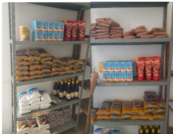
Figura 2 – Estoque de alimentos