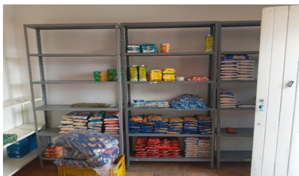
Figura 1 – Estoque de alimentos.

Na Figura 1 e 2, apresentada a seguir, é possível visualizar um exemplo de organização do estoque de alimentos da Secretaria.