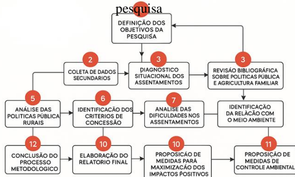
Figura 3 – Fluxograma com etapas metodológicas da pesquisa, de acordo com os objetivos específicos da

Na Figura 3, apresenta-se o fluxograma com as etapas metodológicas da pesquisa.