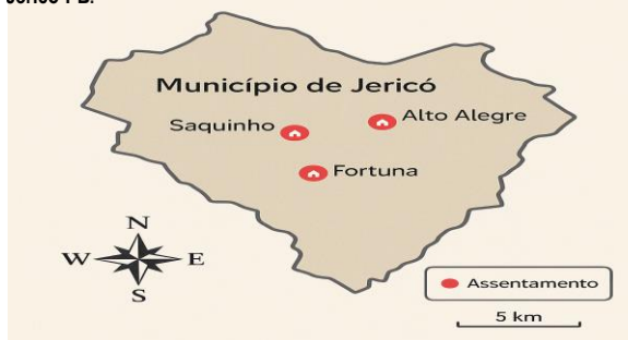
Figura 2. Localização geográfica dos assentamentos rurais do município de Jericó-PB.

A economia do município de Jericó-PB tem como base o setor primário, cuja participação varia entre 75,1% a 100% da atividade econômica local. Em seguida, destaca-se o setor terciário, com contribuição entre 5,1% e 25%, enquanto o setor secundário apresenta participação modesta, entre 0% e 5,1%. O principal suporte da economia é a agricultura, com destaque para o cultivo de mandioca, feijão e milho. Na pecuária, sobressai-se a criação de bovinos e, na avicultura, a criação de galináceos com produção de ovos (IBGE, 2024).