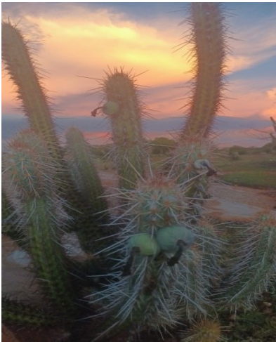
Figura 1: Matrizes de xiquexique ( Pilosocereus gounellei ) em áreas de ocorrência natural para coleta dos frutos, Catolé do Rocha-PB, 2024.

O experimento foi realizado no município de