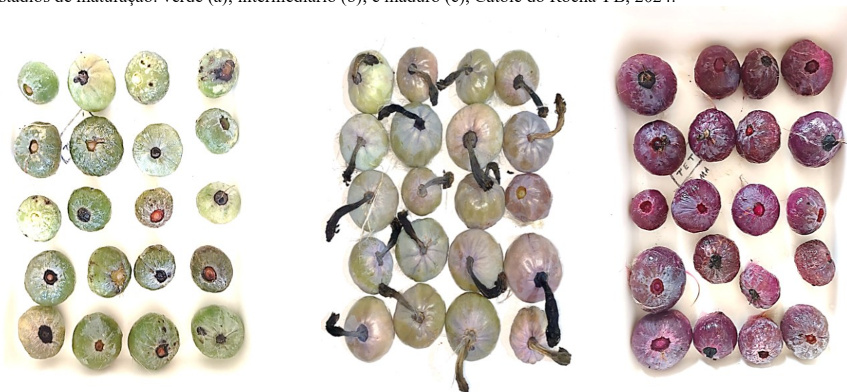
Figura 2: Frutos de xiquexique ( Pilosocereus gounellei (F.A.C.Weber) Byles & Rowley) coletados em diferentes estádios de maturação: verde (a); intermediário (b); e maduro (c), Catolé do Rocha-PB, 2024.