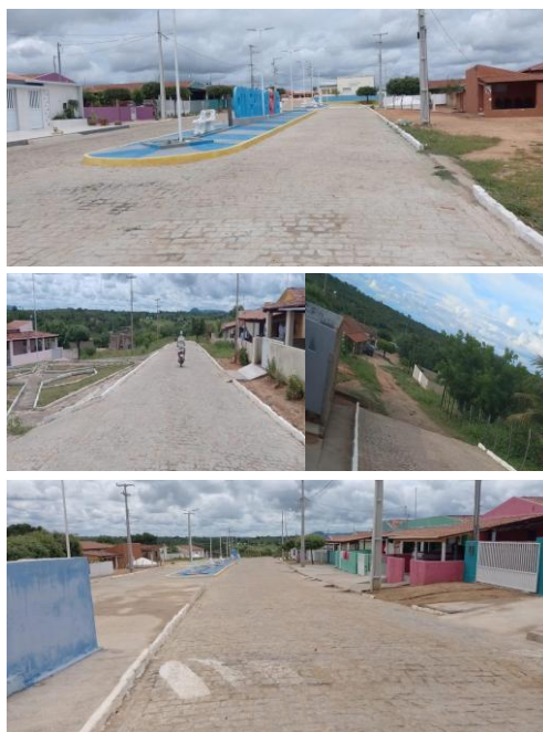
Figura 5: Distrito do Barrento.