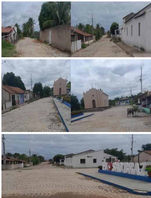
Figura 6: Distrito do São Braz I.