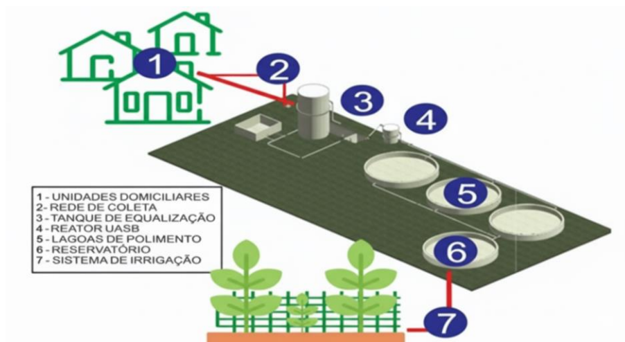
Figura 3 - Esquema de funcionamento do Sistema (SARA)

o SARA consiste em um sistema integrado que combina diversas etapas de tratamento: a caixa de gordura, que retém óleos e graxas; o tanque de equalização, responsável por regular o fluxo de esgoto e facilitar a remoção de sólidos sedimentáveis; o reator UASB (Upflow Anaerobic Sludge Blanket), no qual microrganismos realizam a digestão da matéria orgânica; e, finalmente, as lagoas de polimento, que completam o processo de purificação e definem a qualidade do efluente para seu posterior reúso, especialmente em atividades agrícolas (Figura 4).