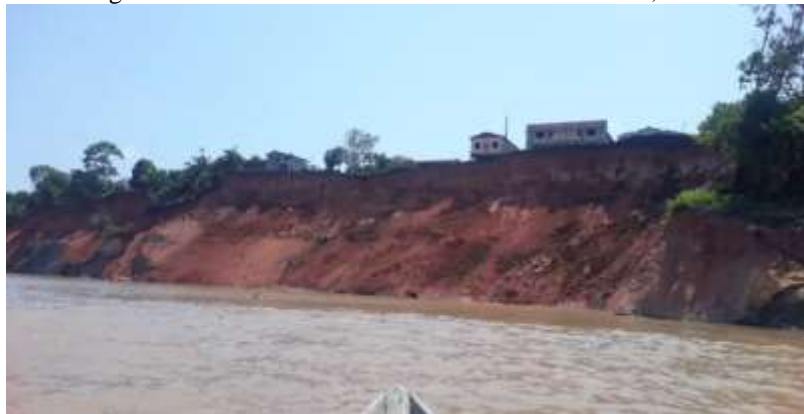
Figura 03 – Deslizamento na Comunidade de Arumã, Beruri