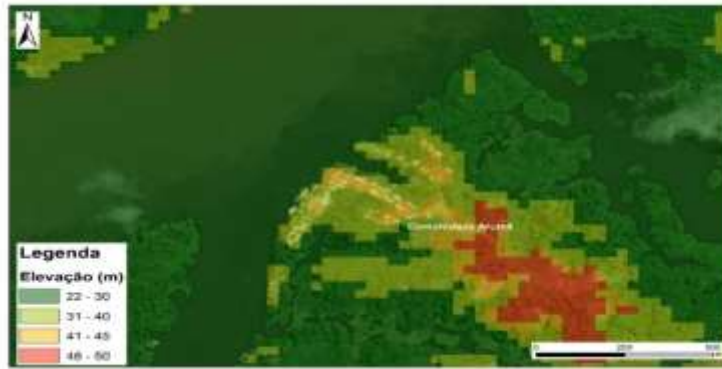
Figura 02 – Comunidade de Arumã.