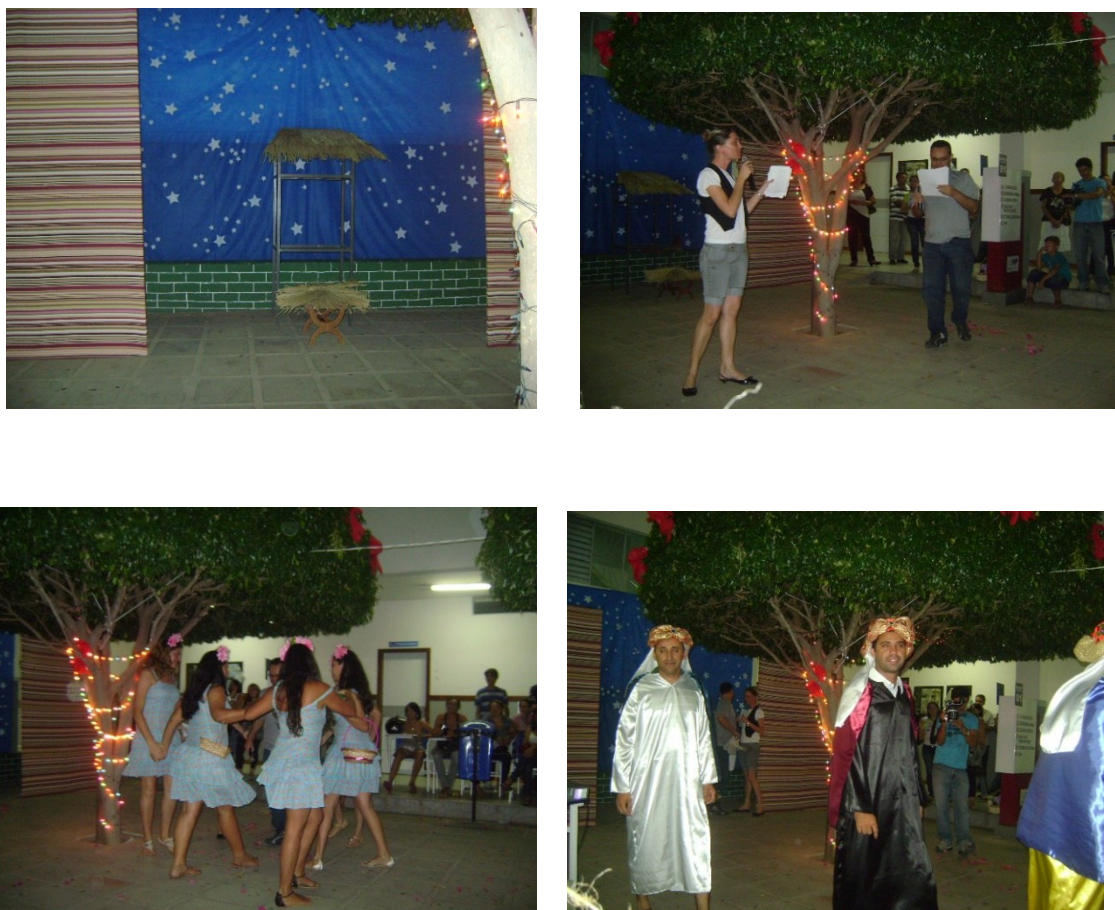
Figura A.3 — Culminância da Performance e Recepção do Público