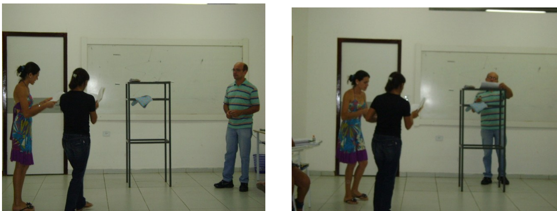
Figura A.2 — Processo de Caracterização e Vestimenta do Elenco